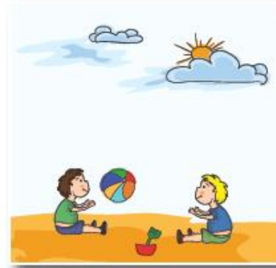
Dos niños juegan.

Vamos a conocer tipos de adjetivos determinativos numerales.