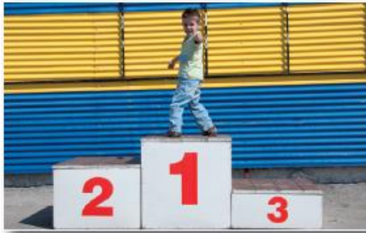
Alonso ganó el primer puesto.