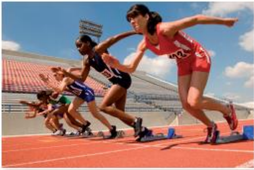
Muchas personas corren.