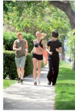
Pocas personas corren.

Alumno (a), vamos a conocer la definición de los adjetivos determinativos indefinidos.